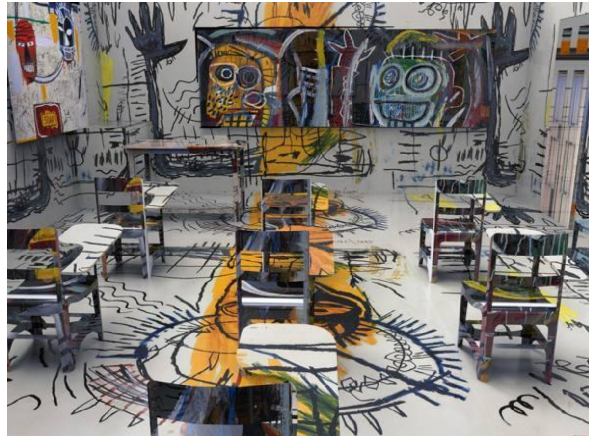
Immagine: Basquiat Classroom, JON RAFMAN, 2013